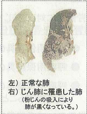
左) 正常な肺 右) じん肺に罹患した肺 (粉じんの吸入により肺が黒くなっている。)

現在、じん肺を治す根本的な治療がないため、じん肺にかからないための措置として、粉じんの発生源対策、局所排気装置等の適正な稼働、呼吸用保護具の適正な着用などにより、粉じんへの「ばく露防止対策」を徹底することが重要です。