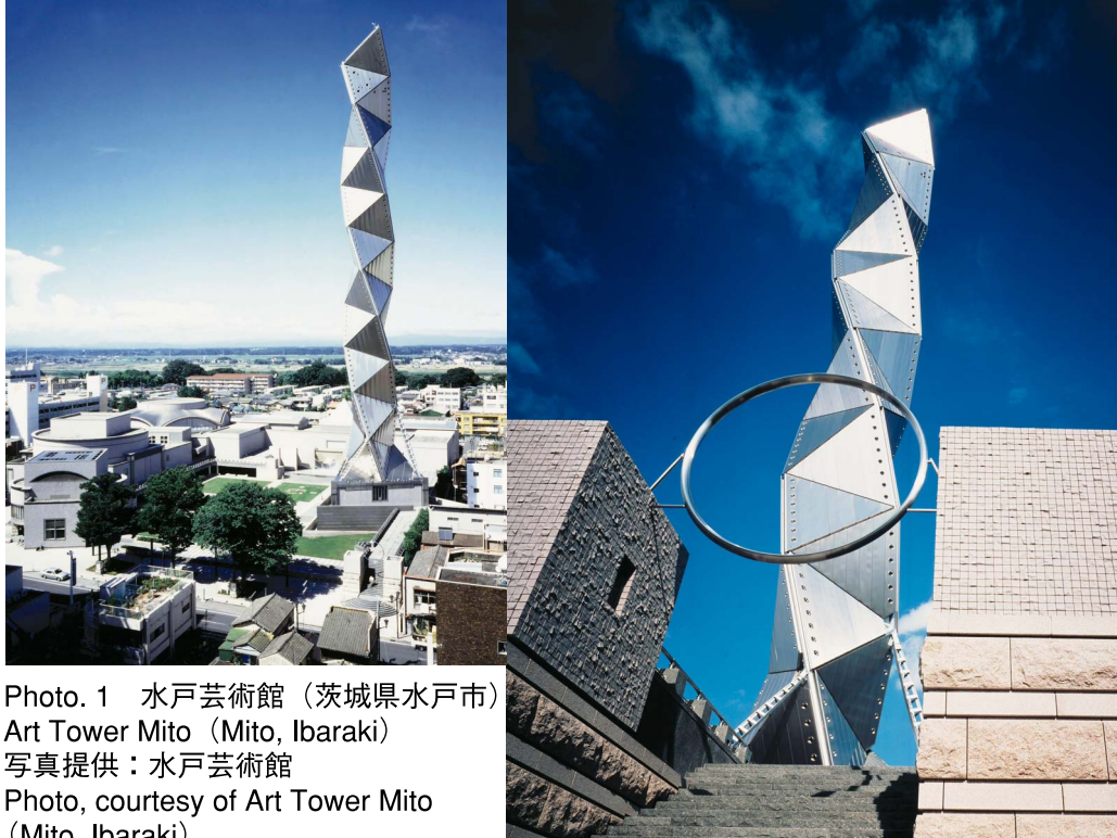
Photo. 1 水戸芸術館 (茨城県水戸市) Art Tower Mito (Mito, Ibaraki)