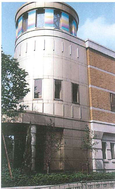
Photo. 4 手塚治虫記念館 (兵庫県宝塚市) Tezuka Osamu Manga Museum (Takarazuka, Hyogo).